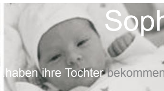
haben ihre Tochter bekommen